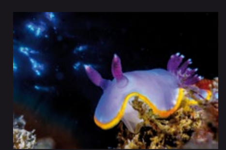
Felimida purpurea • Doris rosada