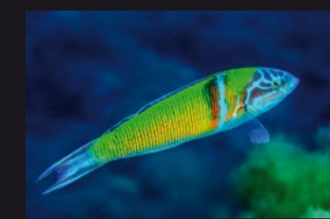
Thalassoma pavo • Fredi