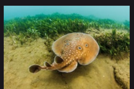
Torpedo torpedo • Tremielga