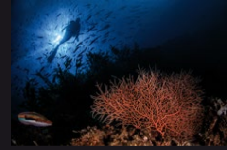
Leptogorgia sarmentosa • Gorgonia anaranjada