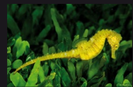
Hippocampus guttulatus • Caballito de mar