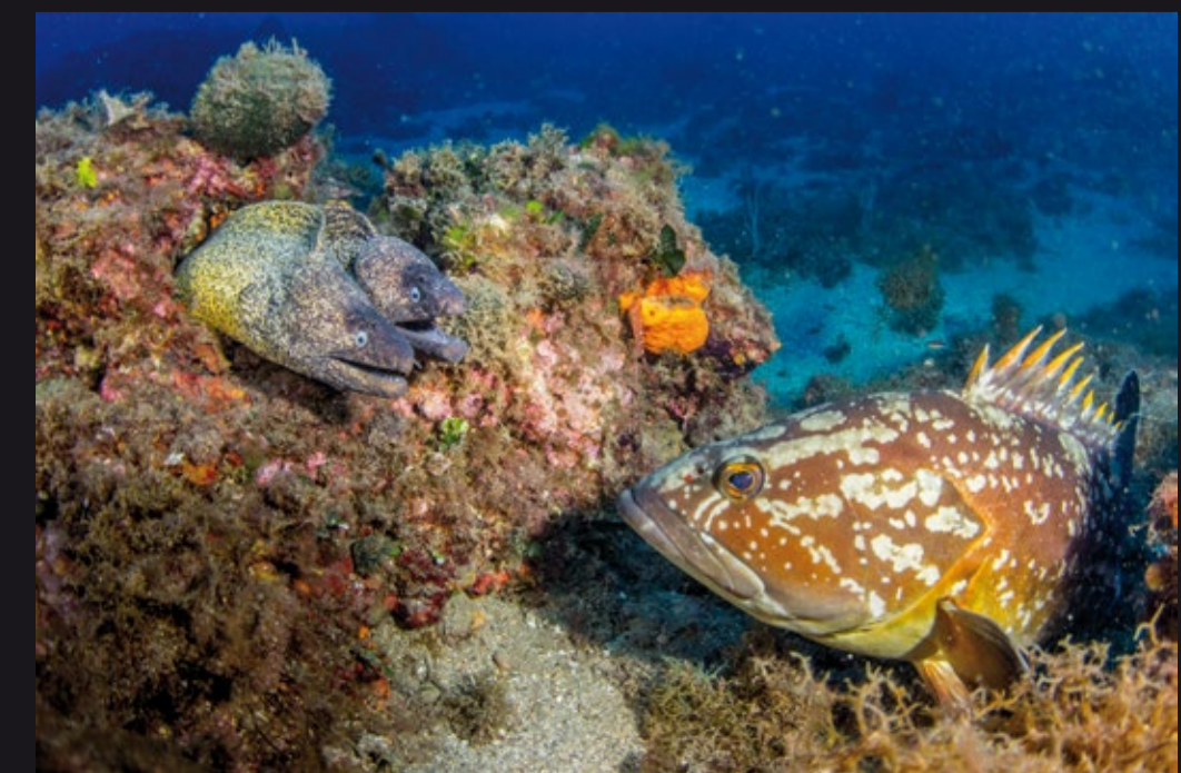
Epinephelus marginatus • Mero moreno / Murena helena • Morena