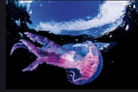
Pelagia noctiluca • Pelagia