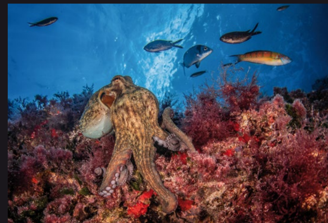
Octopus vulgaris • Pulpo común