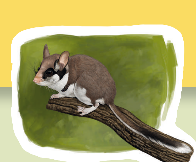
Lirón careto Rata cellarda Garden Dormouse ( Eliomys quercinus )