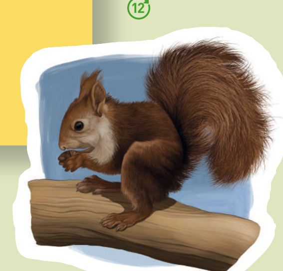
Ardilla Esquirol Eurasian Red Squirrel ( Sciurus vulgaris )

Además, los cielos de la comarca son surcados por distintas especies de rapaces más o menos ligadas a estos sotos. Busardos ratoneros, Águilas calzadas, Culebreras europeas, Gavilanes o Milanos negros y reales utilizan algunos árboles del soto para instalar sus nidos o aprovechan las vegas para cazar en sus pasos migratorios.