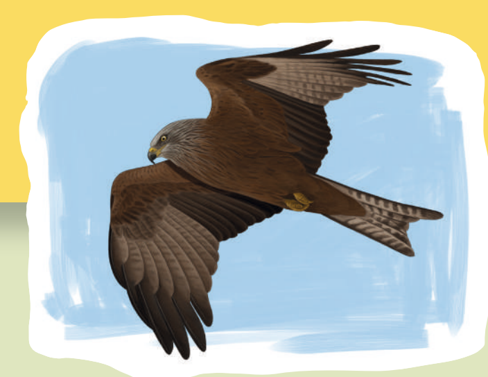
Milano negro Milà negre Black Kite ( Milvus migrans )