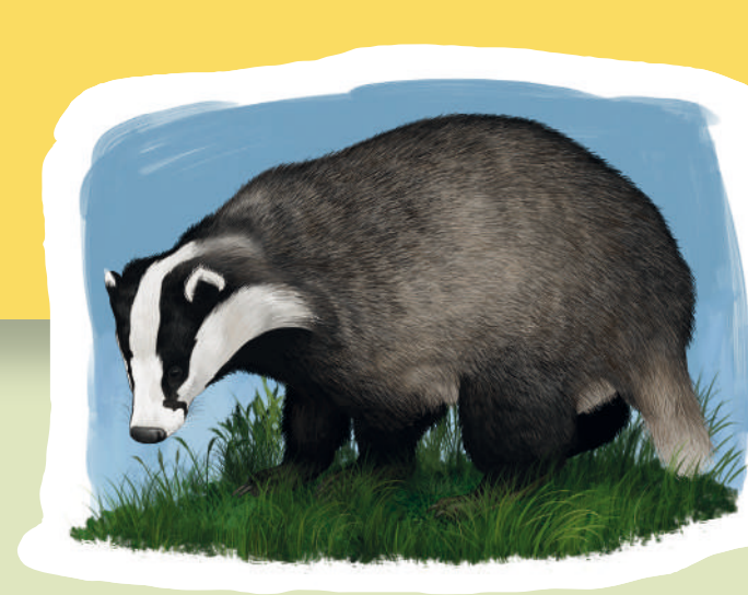
Tejón Teixó Badger ( Meles meles )