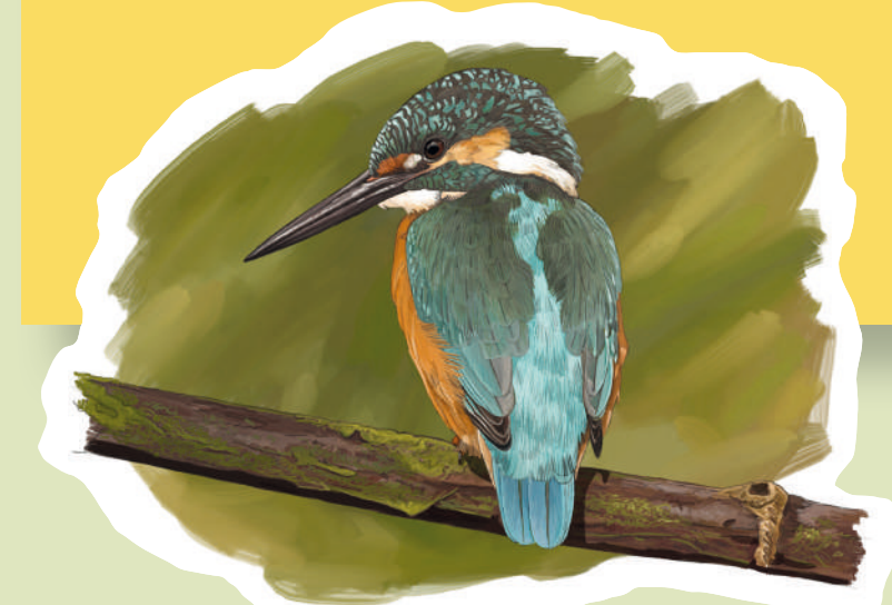
Martín pescador Águila calzada Baldied Eagle ( Aquila pennata )