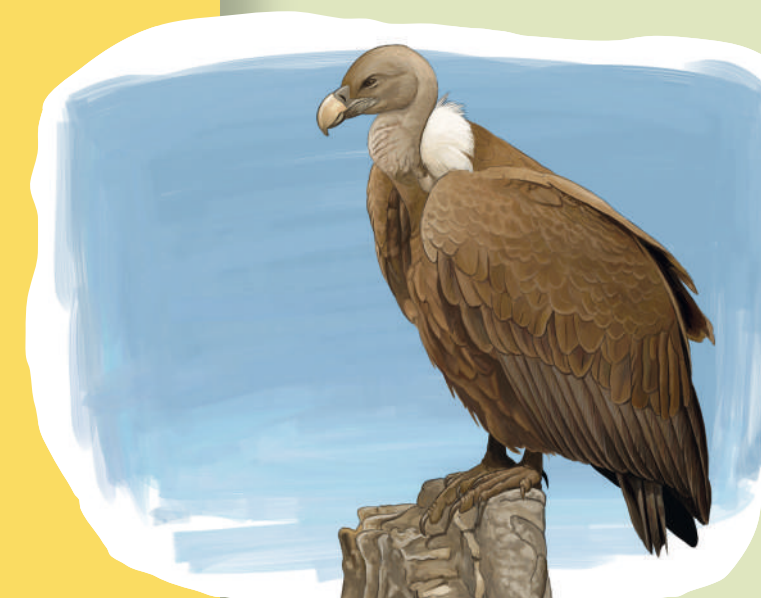
Buitre leonado Vultur Black-earred wheatear ( Oxyptilus fulvus )