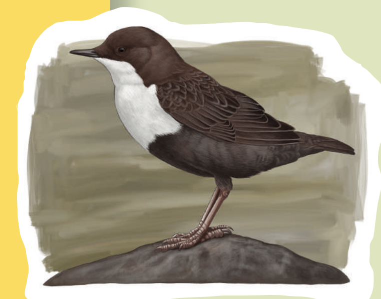
Mirlo acuático Merla d'aigua White-troated dipper ( Cinclus cinclus )

A toda esta avifauna hay que añadir otras especies de mamíferos que han encontrado en un territorio poco poblado y bien conservado un refugio ideal. El corzo , la cabra montés , el tejón , la garduña , la ardilla ... y micromamíferos como lirones, ratones de campo o musarañas , son especies que un senderista podría encontrarse caminando por las rutas de Ademuz.