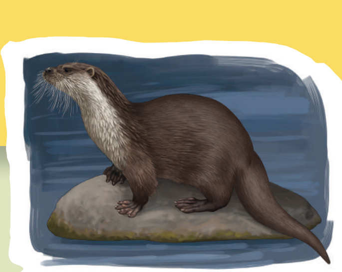
Nutria Lludriga Otter ( Lutra lutra )